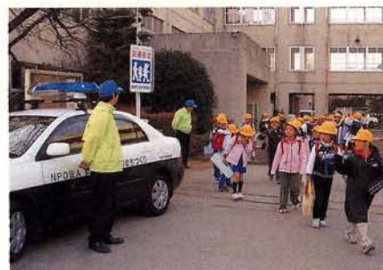
生徒の下校時間に合わせて、小学校校門でパトロールを実施