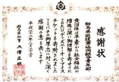
県知事から授与された感謝状 [写真②]