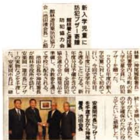
防犯ブザー寄贈活動を報道する新聞記事 [写真③]