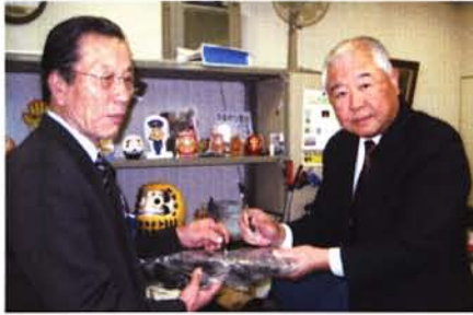
防犯標語入りボールペンを寄贈 [写真①]