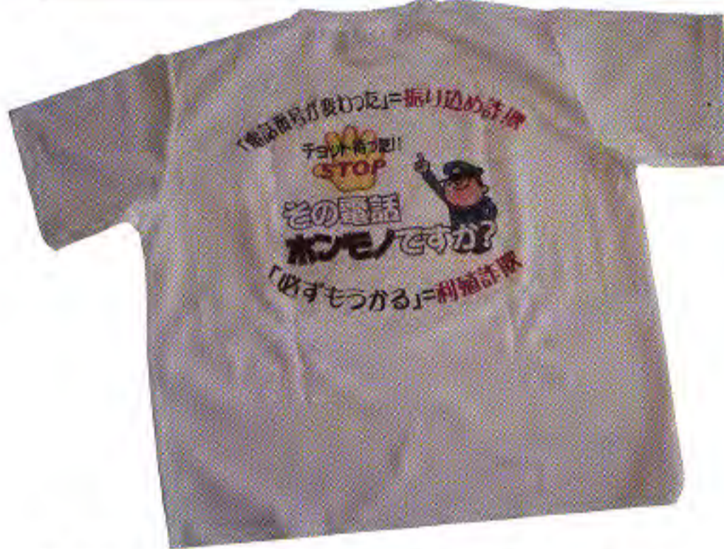
防犯Tシャツを作成。従業員が着用し、来店客へ振り込め詐欺被害防止を訴える [写真①] [写真②]