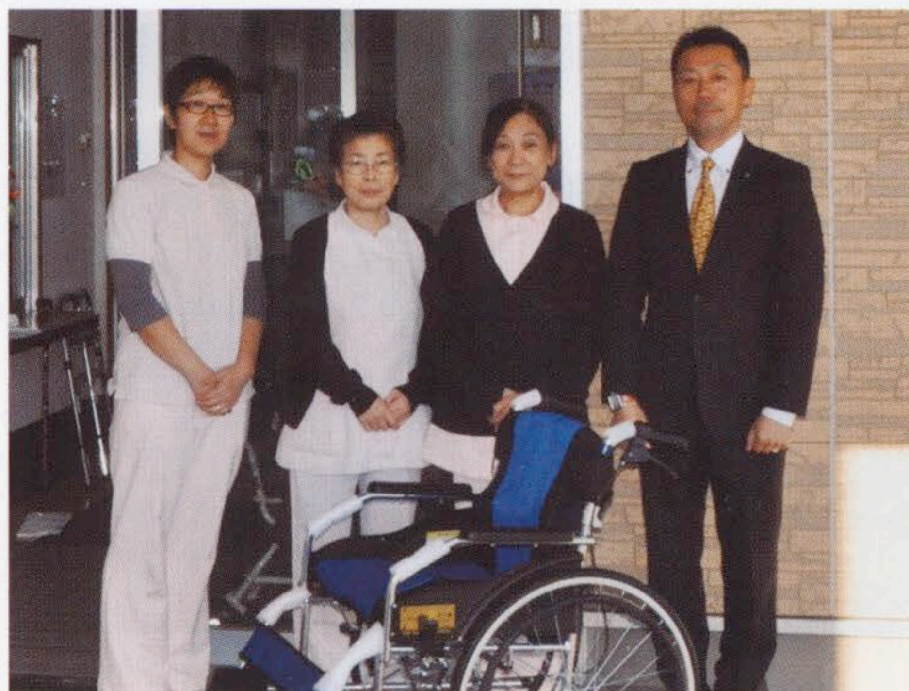
高齢者福祉施設に車いすを寄贈 [写真③]