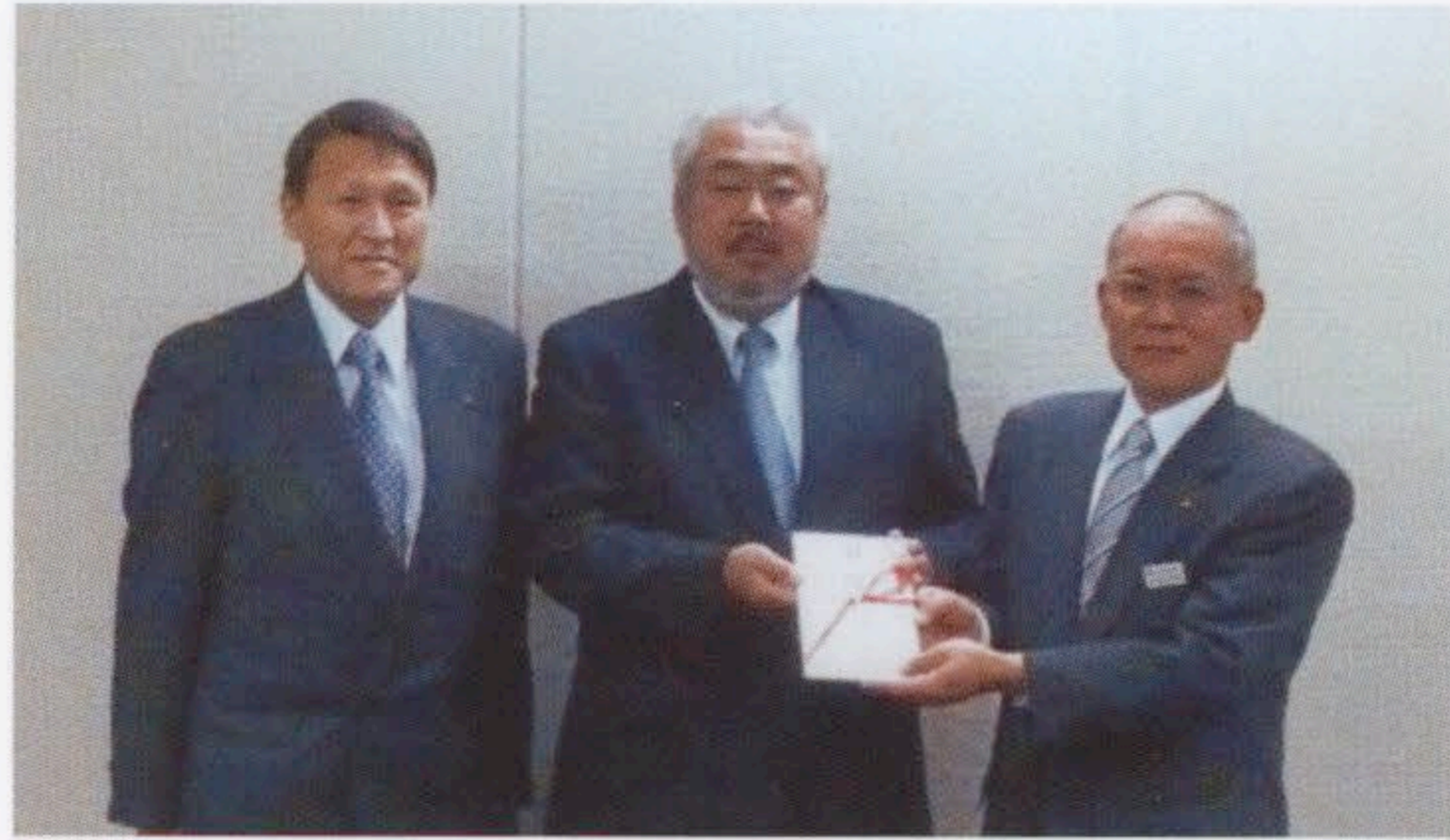
高齢者施設に車いすを寄贈 [写真①]