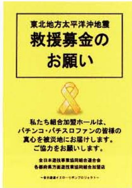
募金箱を設置し、義援金を寄付【写真①】