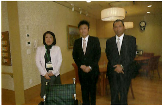
車いすを贈呈【写真②】