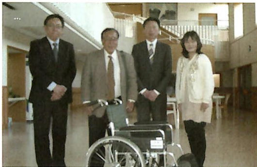
高齢者福祉施設に車いすを贈呈 [写真②]