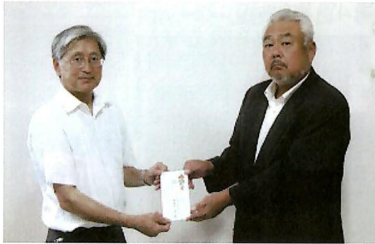
群馬県児童養護施設へ寄付 [写真①]