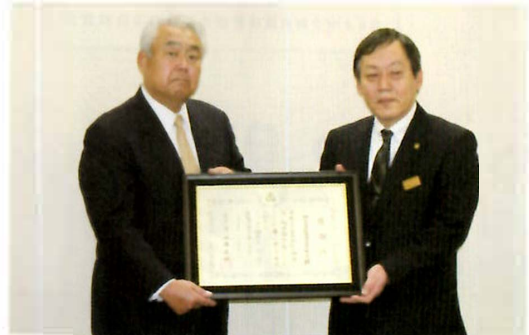
高齢者福祉施設に車いすを贈呈し、県知事から感謝状を受領[写真①②③]