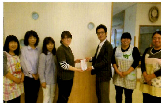
児童養護施設へ寄付 [写真③]