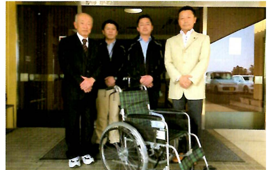
車いすの贈呈式 [写真②]