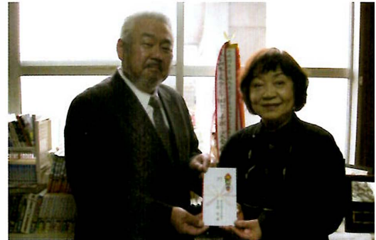
寄付金の贈呈式 [写真①]