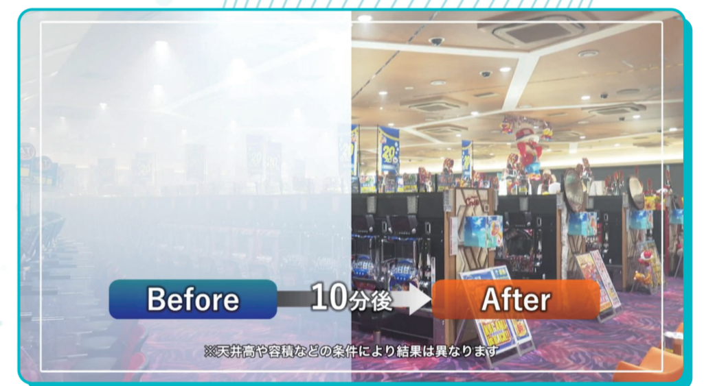
▶ 換気実証実験（煙の換気実験）